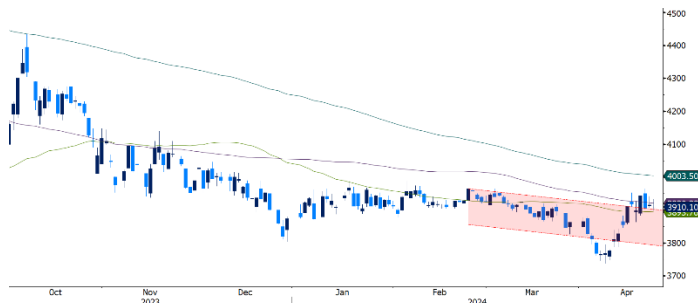
Gráfico 3. Comportamiento USDCOP

El par USDCOP operó durante la semana con un sesgo alcista, operando nuevamente por encima de los $3.900, en un rango entre $3.863 y $3.964,9, con un valor promedio de $3.917,9. Durante las últimas jornadas el peso se había favorecido por la relativa calma en los mercados y los flujos de divisas para pago de impuestos de grandes contribuyentes y de la OPA de Nutresa, en ausencia de estos flujos es probable que el par sea presionado al alza, actualmente ha regresado al rango entre $3.890 y $3.965, de romper al alza podría ir a buscar los $3.987 (máximo del año) y el nivel técnico de $4.003. Sin embargo, de operar por debajo del soporte ($3.890), podría oscilar entre $3.863 y $3.820.