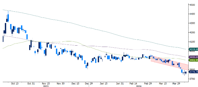
Gráfico 3. Comportamiento USDCOP

El par USDCOP operó durante la semana a la baja y acumula una apreciación del 1,17% desde el 03 de abril. El par ha oscilado en un rango entre $3.736,25 y $3.829,90, con un valor promedio de $3.776,81. La dinámica del dólar ha sido impulsada por: i) el flujo de divisas que proviene para el pago de impuestos de grandes contribuyentes en abril; ii) el flujo de dólares por la OPA de Nutresa, la cual asciende a aproximadamente $US 1.224M; y iii) el repunte de los precios del petróleo y el café. Durante la semana, el USDCOP ha operado a la baja, rompió el mínimo del 2023 de $3803 para llegar a niveles no vistos desde abril del 2022, operando entre $3.736 y $3.780. El par podría continuar operando entre los $3.720 y $3.800; de ser presionado a la baja podría buscar los $3.700, de lo contrario, los niveles a monitorear serían $3.800 y $3.845.